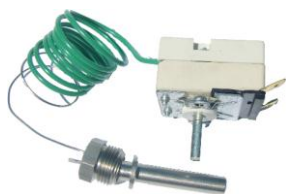
TERMOSTAT 380 V, 16 A 30 – 155°C, 1520 mm Gwint zew. 3/8" Z01051