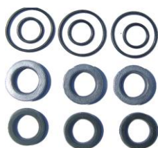
ZESTAW USZCZELNIENÍ LAVOR / FASA Ø15 4 x 3 sztuki ZU00151