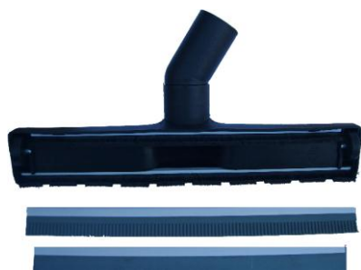
SSAWKA SUCHO/MOKRO + LISTY GUMOWE