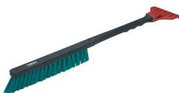
SZCZOTKA + SKROBACZKA DO ŚNIEGU