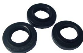
PIERŚCIEŃ OLEJOWE LAVOR / FASA Ø15 3 sztuki ZU00152