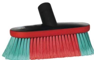
SZCZOTKA DO FELG