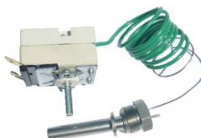
TERMOSTAT 380 V, 16 A 0 – 152°C, 920 mm Gwint zew. 3/8" Z01055