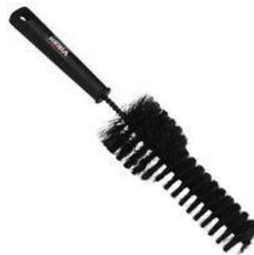
SZCZOTKA DO FELG