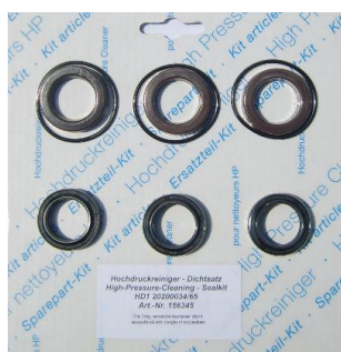
ZESTAW USZCZELNIENÍ Ø20 3 x 3 sztuki HD 1090 HD 1294 ZU00105