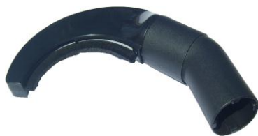
SSAWKA PÓŁOKRĄGŁA DO GRZEJNIKÓW