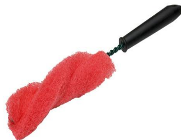
SZCZOTKA DO FELG