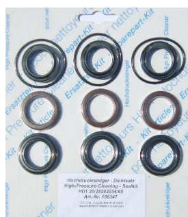
ZESTAW USZCZELNIENÍ Ø20 4 x 3 sztuki HD 215 HDS 655 HD 1050 HDS 745 HD 1090 HDS 755 HD 750 HDS 800 HD 850 HDS 801 HD 860 HDS 850 HD 1200 HDS 890 HD 690 HDS 990 HDS 750 HDS 1000 ZU00106