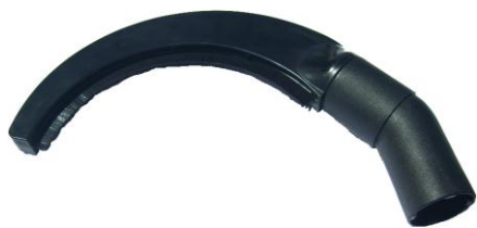
SSAWKA PÓŁOKRĄGŁA DO GRZEJNIKÓW