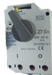
WYŁĄCZNIK OKN 22,0 – 27,0 A Z01002