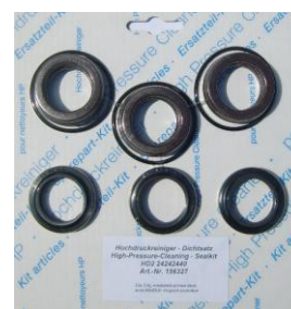
ZESTAW USZCZELNIENÍ Ø24 4 x 3 sztuki HDS 1210 HDS 1250 HDS 1290 ST HDS 1290 STL HDS 1390 HDS 860 HDS 1200 HDS 1090 HDS 750 HDS 690 ZU00107