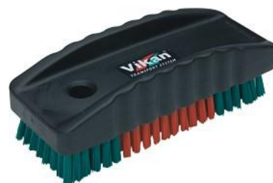
SZCZOTKA DO RĄK