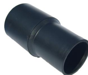
REDUKCJA SSAWKI 32 mm → 35 mm