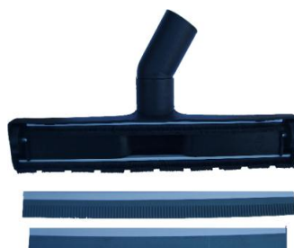
SSAWKA SUCHO/MOKRO + LISTY GUMOWE