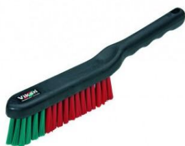
SZCZOTKA DO TAPICERKI