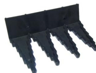
WIESZAK NA AKCESORIA VIKAN